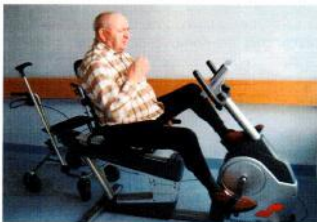
Cvičení - rotoped

K pravidelným aktivitám patří společenské hry, jejichž záměrem je nejen se pobavit a zasmát, ale i trénovat myšlení a paměť. Mezi nejoblíbenější hry patří šipky, kuličky bowling a člověče nezlob se.