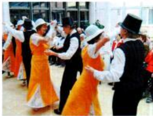
Vystoupení skupiny Hanka