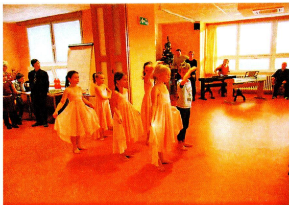
Vystoupení žáků LŠU Domažlice