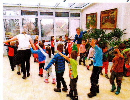
Vystoupení MŠ - zimní pohádka