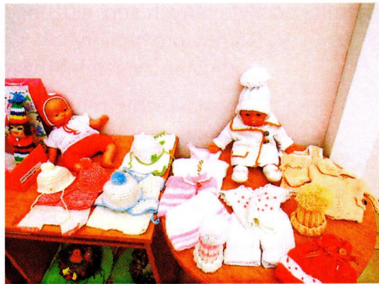
Ruční práce - oblečky pro panenky