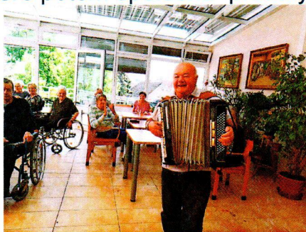
Kafíčko v zimní zahradě

Dvě klientky DpS Domažlice vyráběly několik týdnů oblečky pro panenky, které potom společně předaly učitelkám a holčičkám jedné ze zdejší MŠ.